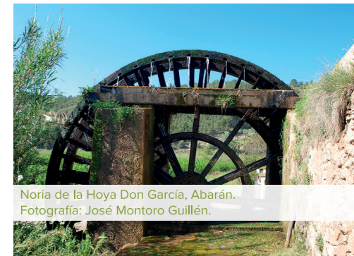
Noria de la Hoya Don García, Abarán.