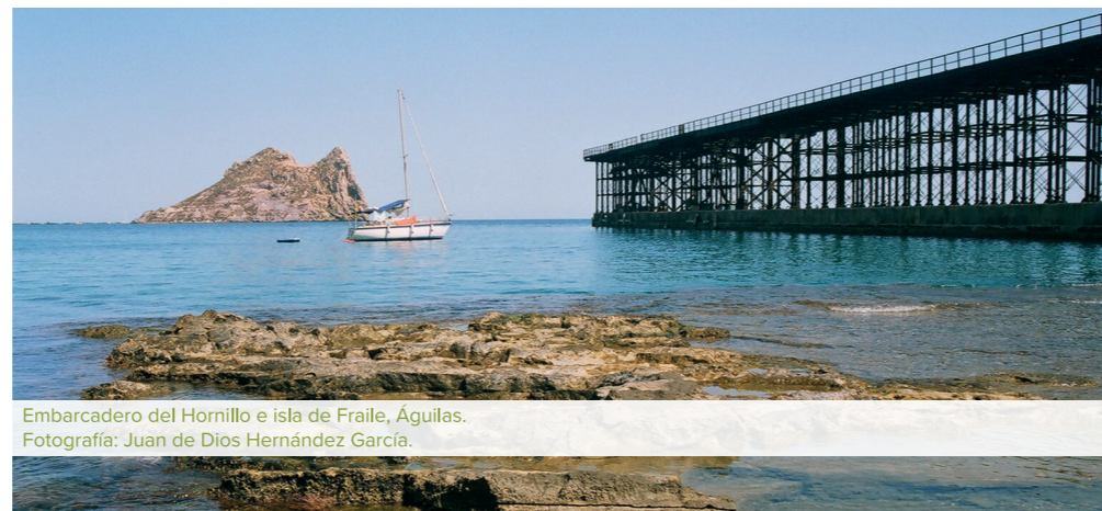
Embarcadero del Hornillo e isla de Fraile, Águilas.

VUELTA EN AUTOBÚS A CARTAGENA CON PARADA EN MURCIA (PLAZA DE LA OPINIÓN), SOBRE LAS 20:30 H.