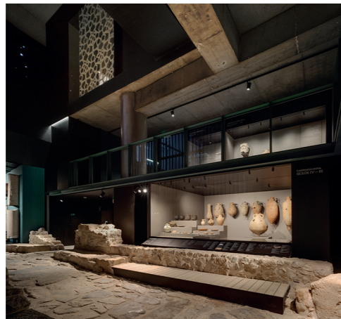
Museo Romano del Foro, Cartagena.