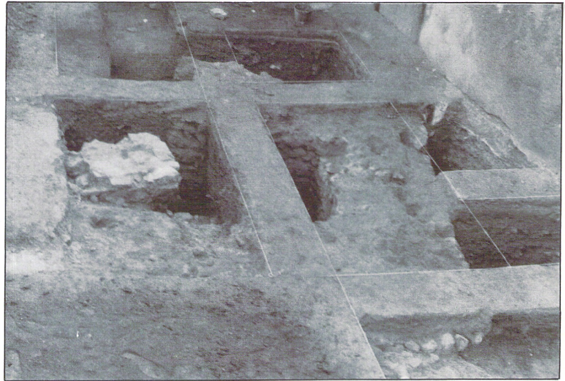
Muro del Anfiteatro, y dos contrafuertes.

La excavación, finalizada el 16 de Enero, quedó de nuevo tapada según se acordó con la dirección de la Plaza en su día.