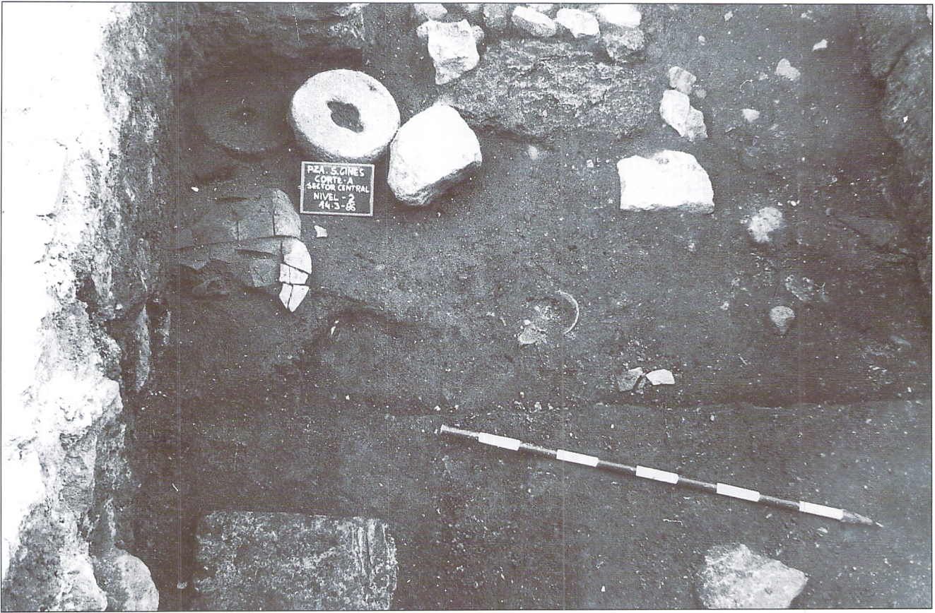
Restos de vivienda de época púnica. (Fines del siglo III a.C.).

Tercera fase: A esta fase corresponden también parte de una calzada y de una habitación que se encuentran orientadas en la misma dirección que las estructuras de la fase anterior.