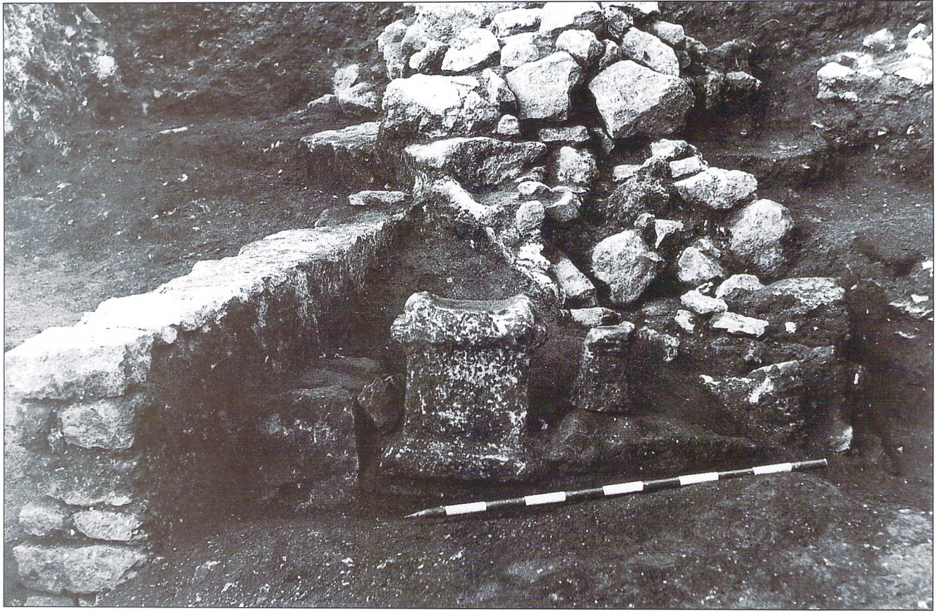
Lararium doméstico (I d.C.).

pletas, además de algunos fragmentos de vajilla de mesa Africana A, lo que nos permitiría fechar esta fase en los inicios del siglo II d.C.