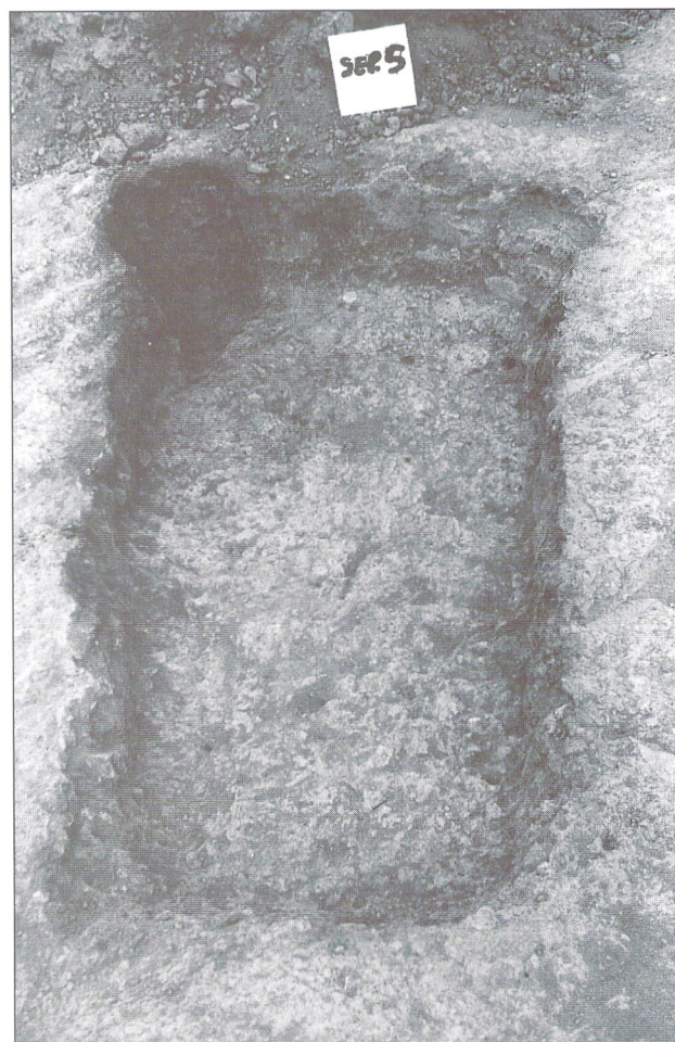
SEP.5. Nicho en forma de lingote chipriota con 2 lóbulos.

Únicamente se procedió a la excavación de aquellos