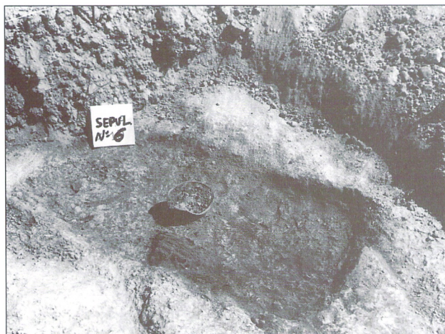
SEP.6. Planta oval simple.