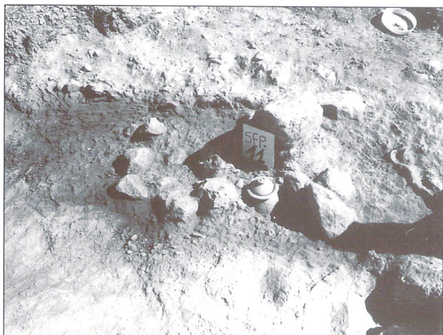
SEP.11. Nicho oval rodeado con piedras.

En algunos casos el nº de lóbulos puede deberse únicamente al grado de deterioro del nicho, no a que se fabricaran así de forma intencionada.