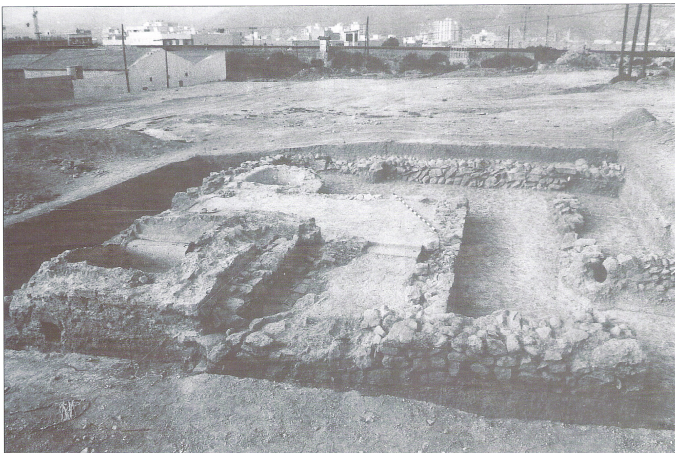
Vista general de las termas desde el N. (nivel III). Abril de 1987.

Nivel II A: Bolsadas de tierra gris cenicienta. Cerámicas comunes romanas. Gran marmita tardorromana hecha a torno con superficie exterior cubierta de tetones. Clara D estampillada.