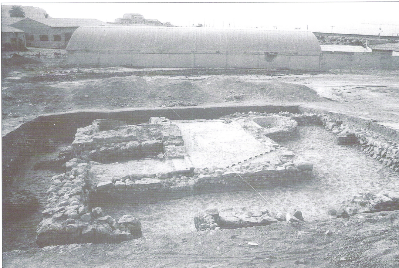
Fuente de las Pulguinas. Vista general de las termas desde el W. (nivel III). Abril de 1987.

cada uno. Ya que durante el período de excavación que se señaló al comienzo se excavó una totalidad de 29 sectores de cortes o cuadrículas, la superficie total de la excavación ha sido de 725 m 2 además de la limpieza de muros que las palas mecánicas descubrieron al norte del núcleo central de la villa. Este núcleo central de la villa está delimitado por las líneas que unen en un cuadrángulo los cortes B-I, B-VI, G-I y G-VI. Las termas de la villa se hallaron en los cortes E-VII, sector 3, E-VII, sector 4 y F-VII (sectores 1 al 4), con muros que se dirigían hacia los cortes E-VI, D-VI y D-V.