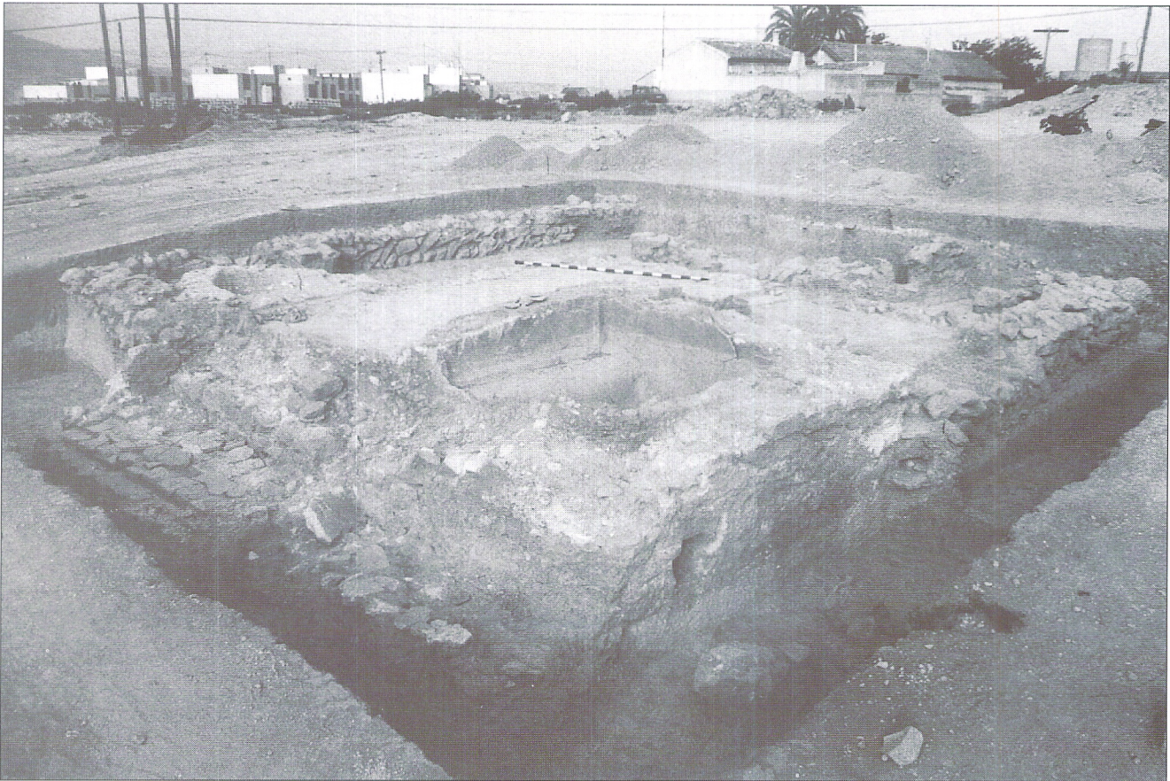
Vista general de las termas desde el NE. (nivel III). Abril de 1987.

Nivel I: Superficial de tierra vegetal marrón grisácea. T.S. Clara D y cerámicas romanas “de borde ahumado” junto a materiales más recientes.