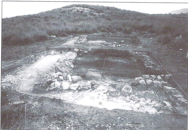
Cortes B-G/7,11 y B-G/1,5. Habitación nº2 y parte de la habitación nº1.

ángulo 3-4 nos aparece un muro con dirección NE-SE de 58 cm. de grosor, formado por piedras unidas con tierra y en algunas zonas con adobe.