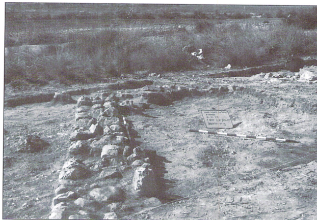
Corte G´K´/65,69 donde apareció parte de la habitación nº3.

Al quitar el esparto que cubría la superficie nos aparece un muro superficial (nº 10) que se mete en el perfil 2. El muro nº 10 se introduce en el ángulo 2-3 y sigue fuera del corte, posiblemente para delimitar otro espacio. Al exterior del muro 10 aparece la roca.