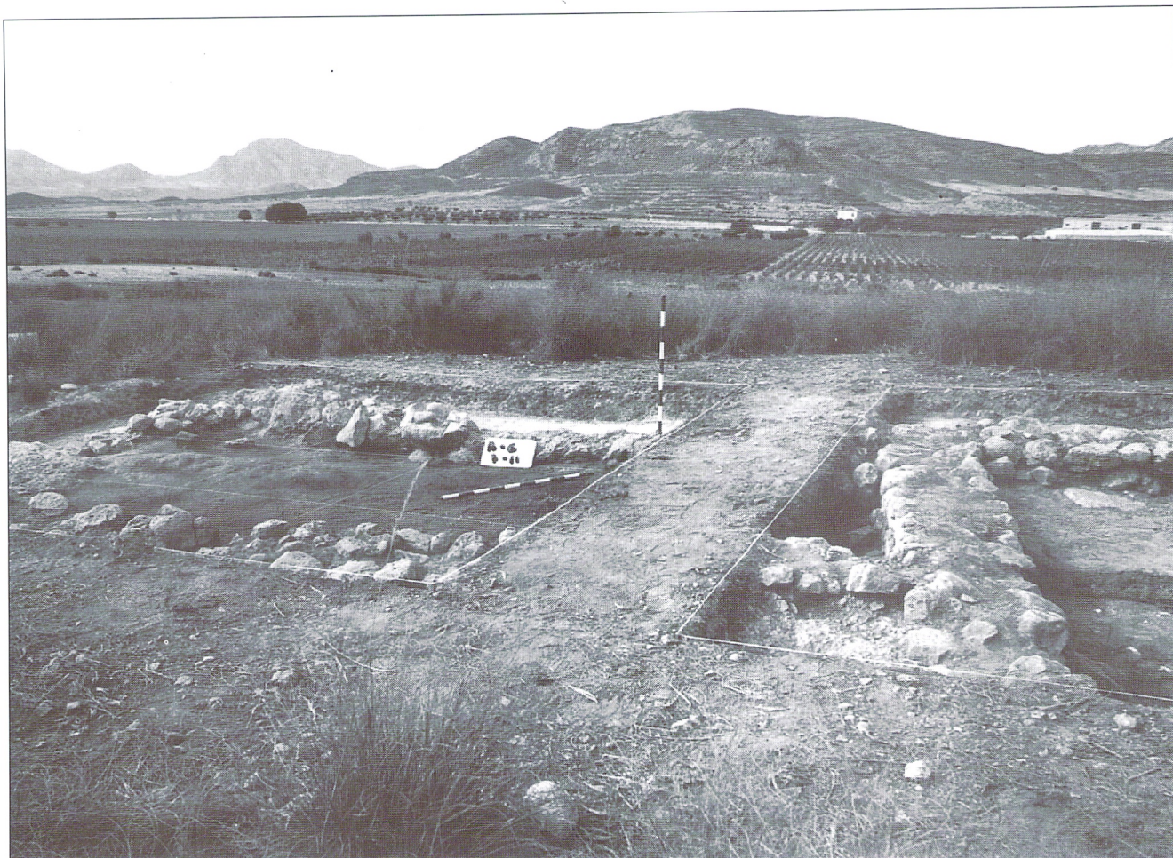
Habitación nº2 en los cortes B-G/7,11 y B-G/1,5

con la entrada orientada al sur (dimensiones de la habitación 2: 4,80 m. de largo por 2,40 m. de anchura). Los muros se disponen igualmente sobre la roca, apareciendo los derrumbes hacia el interior de la habitación.