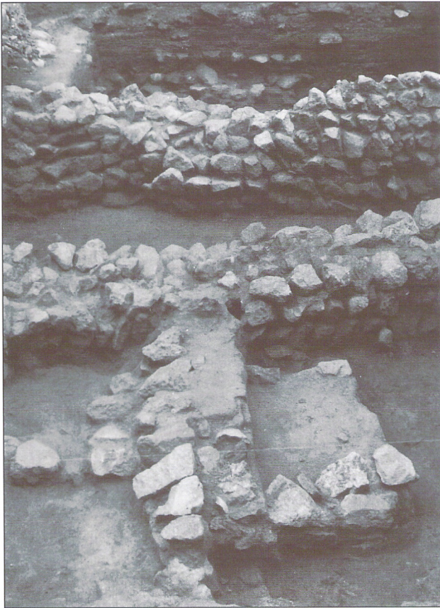
Detalle de los muros confeccionados con un aparejo de mampostería dispuesto en forma de espiga.

En la zona más próxima al perfil 3, y entre éste y el muro 2 hay una zona de tierra marrón anaranjada con carbones a la que también se le considera estrato IIIb, pero con el número de inventario particular, el Z/B-III/51.-