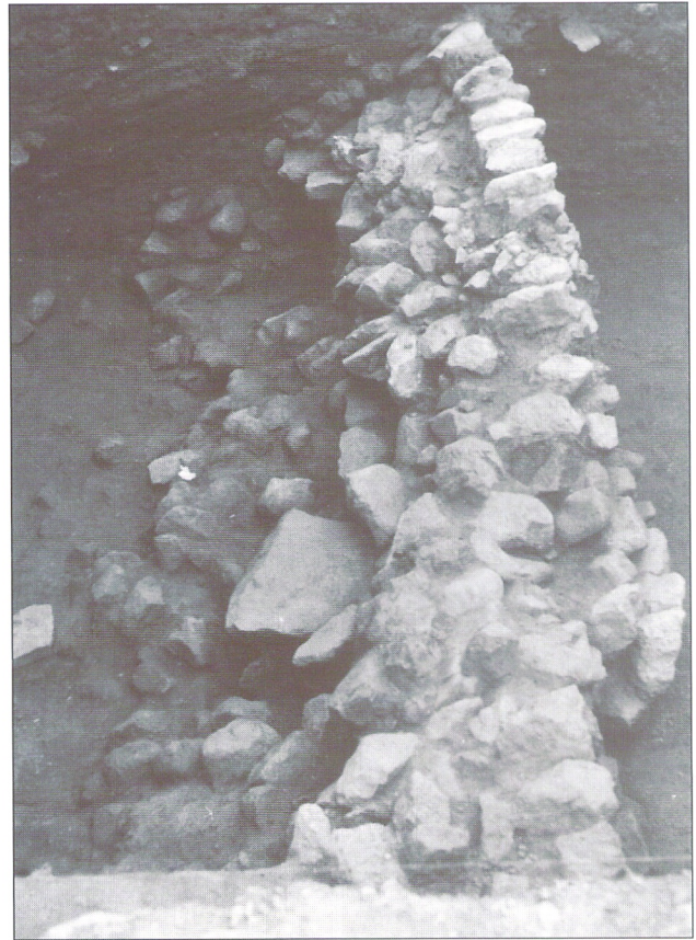
Detalle del muro 1 (sector B) donde se aprecia el potente derrumbe con buzamiento de la estratigrafía reflejada en el perfil 2.

Es un muro, o alineación de piedras, de considerable tamaño, que se encuentra muy próximo y totalmente para-