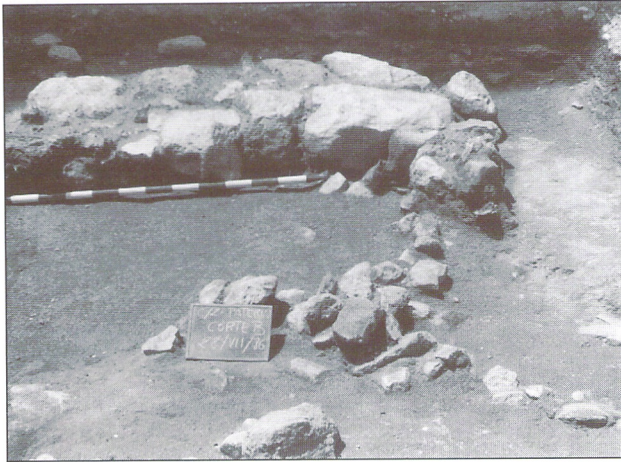
Detalle de la cimentación de un muro del siglo II a.C. (estructura nº 1 sector A)