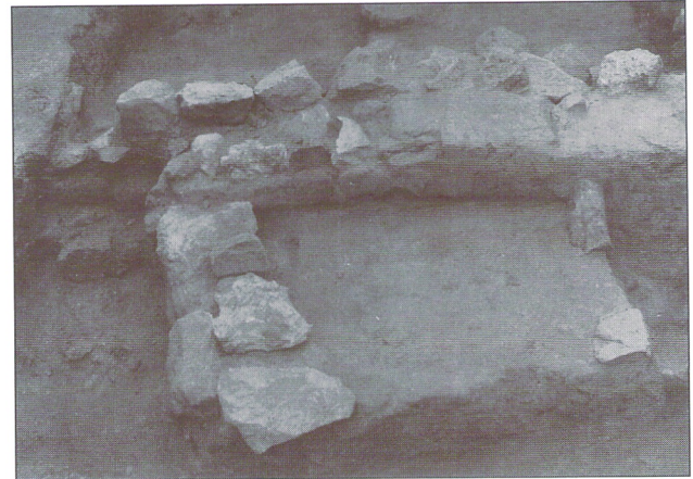
Detalle del banco revocado de adobe que se adosaba a un murete de compartimentación donde se aprecia el alzado de adobe.

Tierra adobosa marrón clara semicomcompacta que buza mucho hacia el perfil 3B. Apoya directamente sobre el