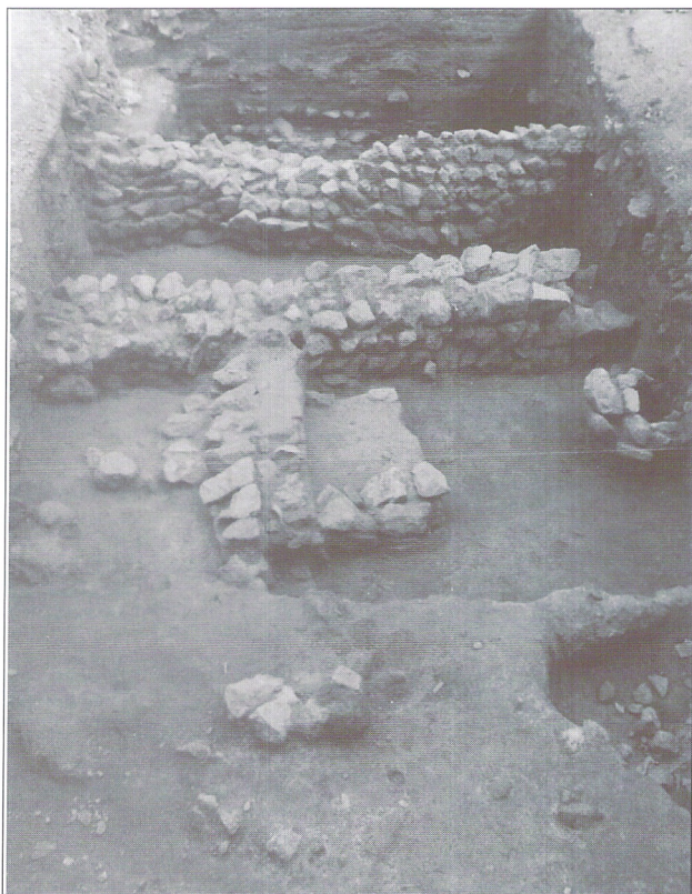
Vista general del corte B con las estructuras argáricas extraídas.

perfil 2, por donde buza ostensiblemente. En esta zona el nivel presenta numerosas piedras de mediano tamaño.